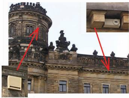
Historisches Polizeipräsidium am Pirnaischen Platz mit Fledermausflachkästen, Mauersegler- und Haussperlingssteinen