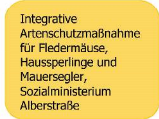
Integrative Artenschutzmaßnahme für Fledermäuse, Haussperlinge und Mauersegler, Sozialministerium Alberstraße