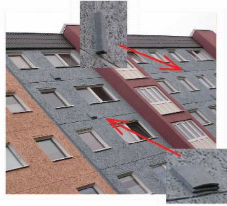
Fledermausröhren und Fledermausflachkästen an einem WBS 70-Plattenbau, Bulgakow-Straße