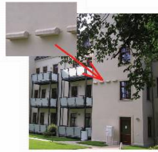
Artenschutzmaßnahmen für Haussperlinge und Fledermäuse, Maxim-Gorki-Straße