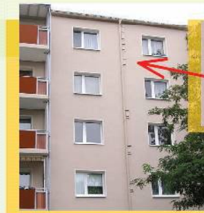
In die Dämmung eingebaute Fledermausröhren mit seitlichem Durchflug zur Dehnungsfuge, Dürerstraße