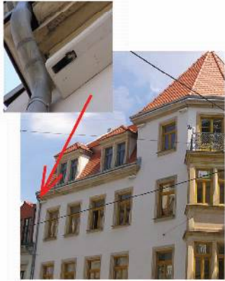
besiedelte Mauersegler- und Haussperlingssteine am Stadtteilhaus, Prießnitzstraße