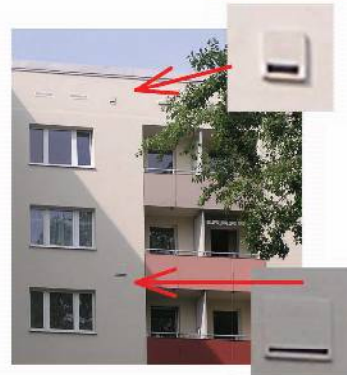
Fledermauseinbaustein und Fledermausflachkasten – eingebaut in die Dämmung des Gebäudes; über den Fledermauseinbaustein können Fledermäuse durch eine Aussparung in der Rückwand in den offenen Dremmel gelangen, Petersburger Straße