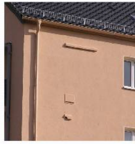
Mauersegler- und Haussperlingskasten, Fledermausflachstein und Halbhöhle einbaustein, Ziegel-Straße